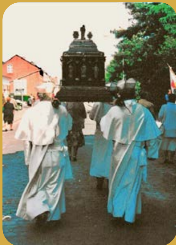
Foto onder: vier witheren van Tongerlo dragen het schrijn van Sint Guibertus ter gelegenheid van de herdenking van 350 jaren Sint Guibertus in Itegem op 23 mei 1999.

In 1972 werd er mee opgehouden en in 1976, het jaar waarin Itegem zijn duizendjarig bestaan vierde, werd de processie hernomen. De processie trok tenslotte nog een laatste keer door de straten in 2009.