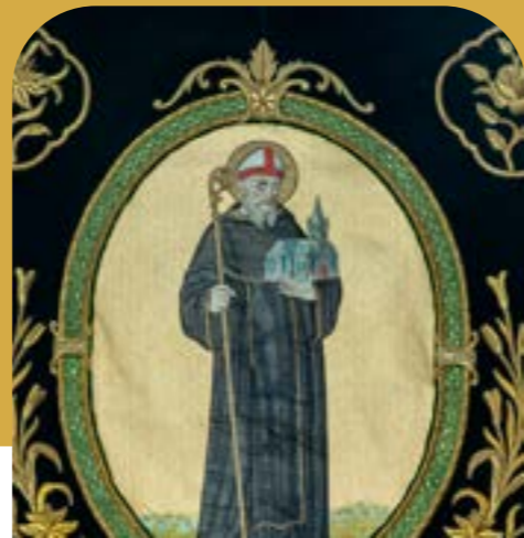
Foto boven en rechts: het schrijn van Sint Guibertus Foto onder: patroonheilige Sint Guibertus

Vroeger, meer dan tien jaren geleden, kenden alle inwoners van Itegem Sint Guibertus van de jaarlijkse processie die door het dorp ging. Met een fanfare voorop en eentje achteraan ging het zo al heel lang mee. In die processie werd een schrijn gedragen.